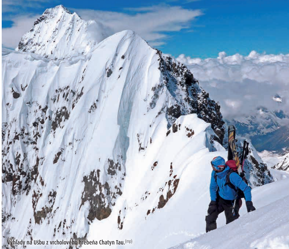
Výhľady na Ušbu z vrcholového hrebeňa Chatyn Tau. (mp)

Tetnuldi (4858 m) JZ hrebeňom Koruldi Peak (3328 m) JV chrbtom Chatyn Tau (4412 m) JV kuloárom Ušba (S vrchol, 4698 m) V kuloárom