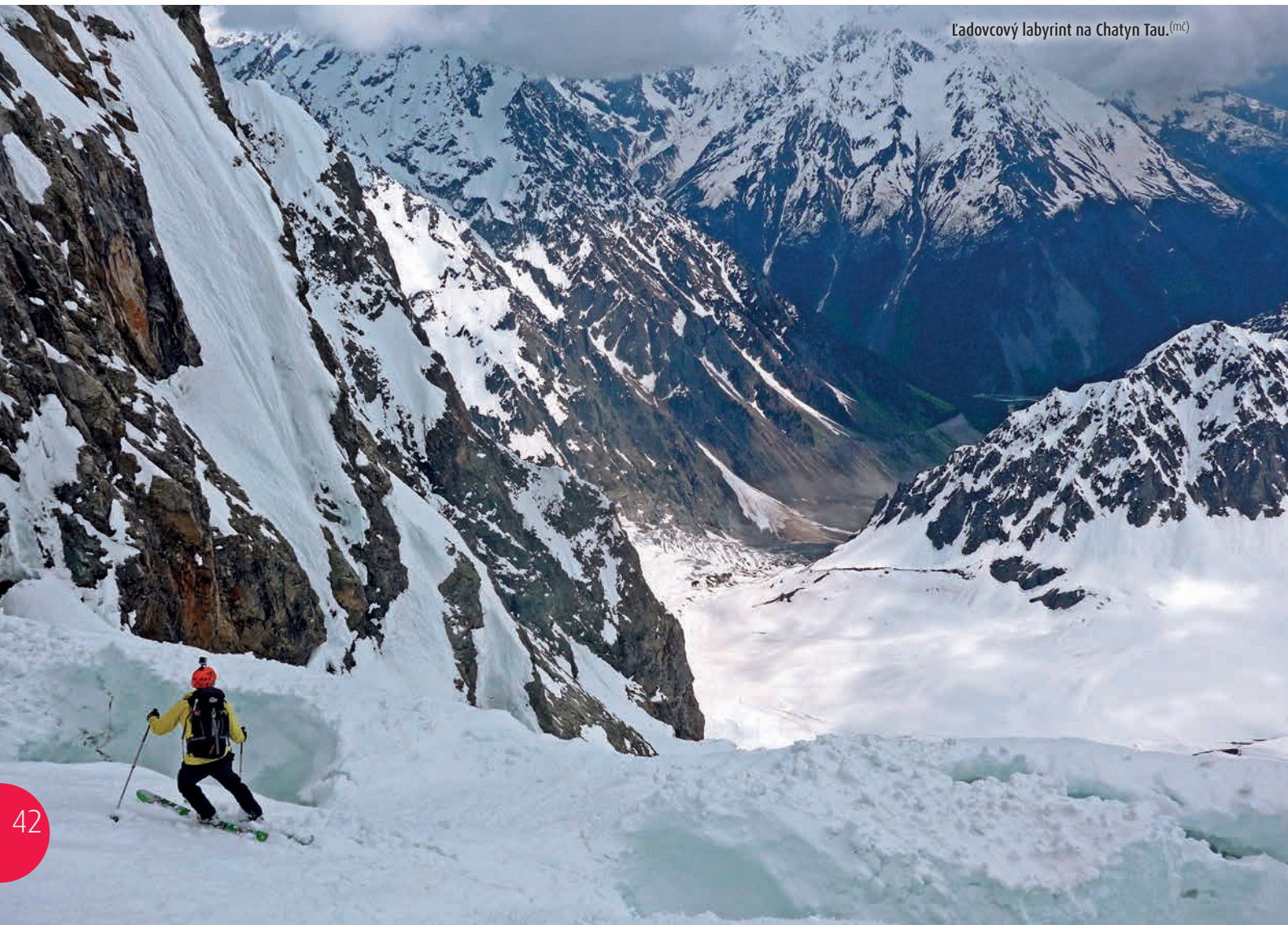
Ladovcový labyrint na Chatyn Tau.