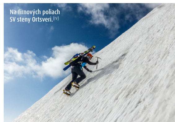
Na firnových poliach SV steny Ortsveri. (iv)

Ráno sa budíme do pocukrovaného slnečného rána napriek silne pesimistickej predpovedi počasia, ktorá na dnešné predpoludnie prorokovala 30 mm zrážok. Neváhame a milo prekvapení ihneď po raňajkách vyrážame na ladovec Gergeti. Júnové slniečko už pripieká a v okolitých stenách začínajú šuchotať splazíky z nového snehu. Pôvodný cieľ SV stenu Ortsveri preto operatívne meníme za bezpečnejší východný svah Elektrozink. Z improvizovanej túry sa nakoniec vyklúla pekná aklimatizačná prechádzka, ktorá nám hore-dole zabrala tri a pol hodiny. Už okolo obeda sme naspäť v Betleheme, takže zvyšok dňa môžeme oddychovať a dúfať, že zajtrajsia