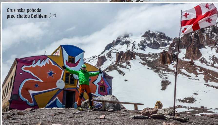
Gruzínska pohoda pred chatou Bethlemi.

vyrážame po chrumkavom kaukazskom firne nahor JV kuloárom. Ten sa zdola nezdá byť až taký dlhý, no rýchlo zisťujeme, že zdanie klame. Najmä keď sa firnová kôra začína boriť a s pribúdajúcou výškou ubúda kyslík. Niežeby bol Kazbek nejaký výškový velikán, ale už aj tých päťtisíc trochu cítiť, keď človek nie je dobre aklimatizovaný. Po šiestich hodinách dosahujeme vrchol. Na jemné štiepanie v hlavičke a prichádzajúcu únavu dávajú rýchlo zabudnúť krásne výhľady. Kazbek je skutočne nádherný výhľadový kopec, pohľady ako z lietadla na všetky svetové strany – z východu na západ sa tiahne hradba divokých kaukazských štítov a ľadovcov, na juhu sa v mori bielych oblakov kúpe Gruzínsko, na severe sa rozprestierajú zelenajúce sa nížiny Ruska. Božský pohľad. Prometheus to tu nemusel mať až také zlé, keď ho sem v minulosti bohovia pripútali za to, že im ukradol oheň a dal ho ľuďom. Ktovie, prečo toľko frľal. Možno mu hore bola kosa, zvykne tu trochu pofukovať. Ale my dnes máme šťastie – je takmer bezvetrie. Akoby Príroda chcela odčiniť dažďe a búrky počas našich prvých dní na Kaukaze, potešila nás nielen počasím, ale aj kvalitným snežikom. Vďaka tomu je následný zjazd