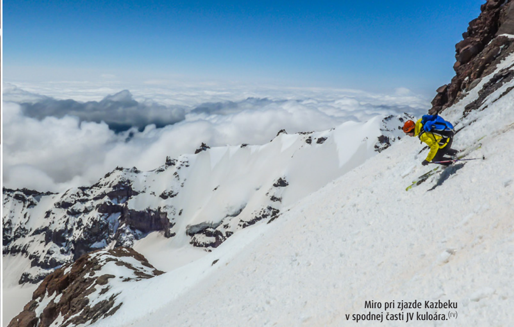
Miro pri zjazde Kazbeku v spodnej časti JV kuloára. (v)